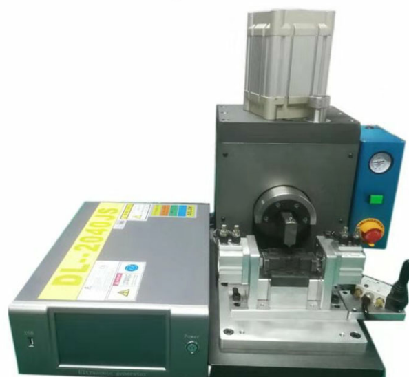
金属超音波接合機