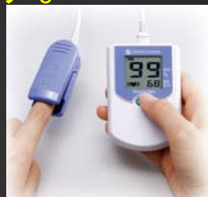
パルスオキシメータ